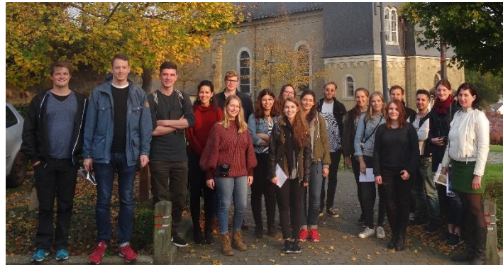
Architekturkurs der RWTH Aachen