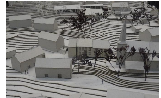
Beispiel eines Gebäudemodells