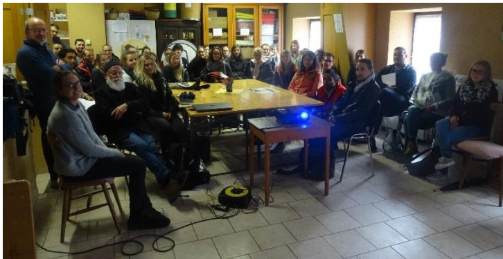
Architekturkurs der Universität Lüttich